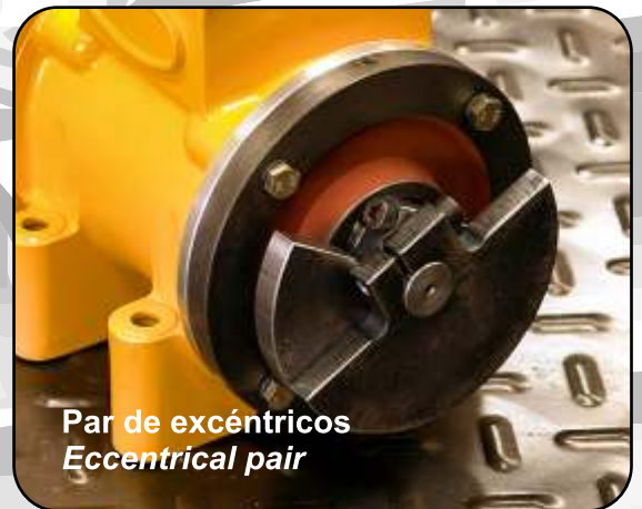
Par de excéntricos Eccentrical pair

The motors are over dimensioned and the external shell complies with Ip65 protect. This isolation makes the vibrator work without being disturbed by dust, humidity or aggressive products.